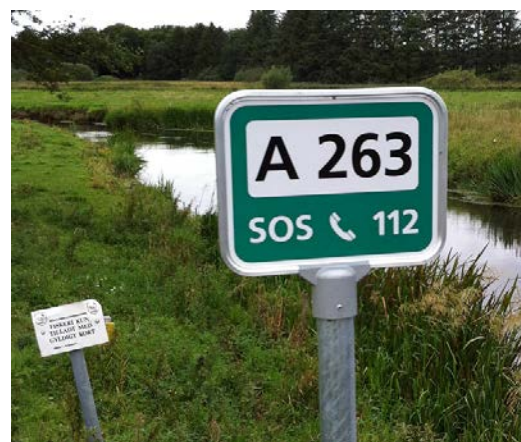
Foto 5 - Strandnummer

Da der ikke altid er en fast adresse på de steder hvor folk befinder sig ved badesteder er der på landsplan udviklet et "strandnummereringssystem", hvor der de steder hvor folk bader eller på anden måde er tæt på vand (søer og større åer) er opsat et skilt – se foto 5. Nummeret består af et bogstav og et 3 cifret tal. I Vejen Kommune er bogstavet A og tallene går fra 250 til 299.