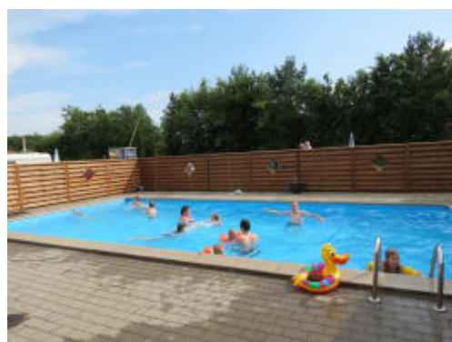
Foto 7 - Holme Å Camping