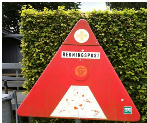
Foto 3 - Redningspost ved Jels Søbad