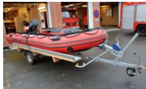
Foto 4 - Redningsbåd

Bådberedskabet aktiveres ved henvendelse til 1-1-2 alarmcentral, som via Falcks vagtcentral i Kolding kalder brandmændene ud ved hjælp af pagere.