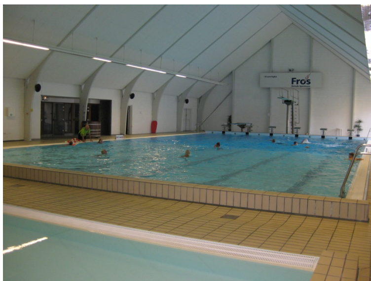
Foto 1 - Rødding svømmehal