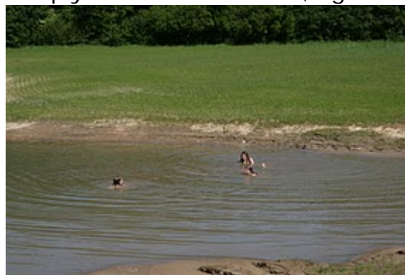
Foto 6- Badesø ved Københoved skov

Såfremt der er steder (ved vand), hvor et sådan skilt ville kunne gøre en forskel kan kommunen opsætte et sådan skilt efter ansøgning fra lodsejeren. Skiltene skal rekvireres via Syd- og Sønderjylland politi.