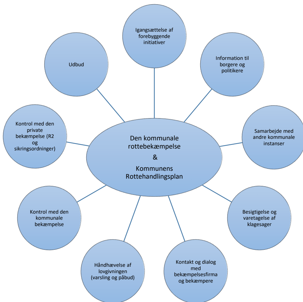
Figur 1. Opgaver i forbindelse med den administrative del af den kommunale rottebekæmpelse.