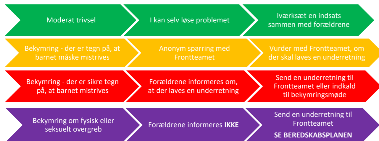
Figur 1 – Forskellige grader af bekymring og tilhørende handlinger.