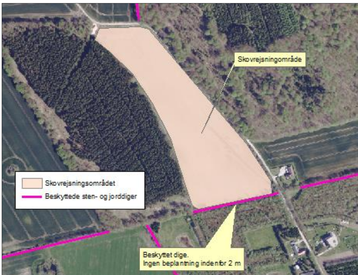
Figur 1. Oversigt over skovrejsningsområdet.