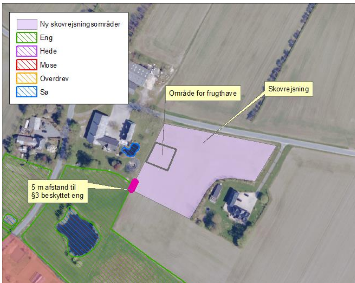
Figur 1. Anlæggets placering og forudsætninger.